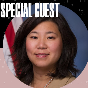
CONGRESSWOMAN GRACE MENG