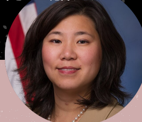
国会众议员 GRACE MENG