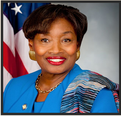
ANDREA STEWART-COUSINS LÍDER MAYORITARIA DEL SENADO